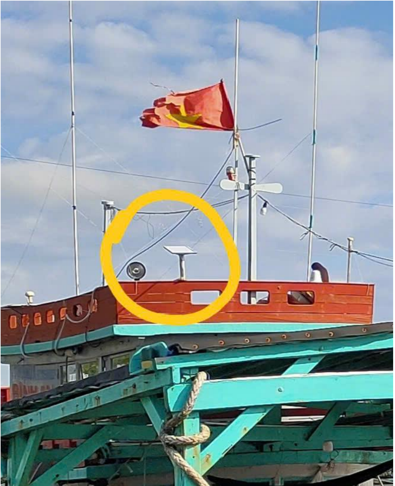
Ăng ten Starlink lắp trên phương tiện nghề cá