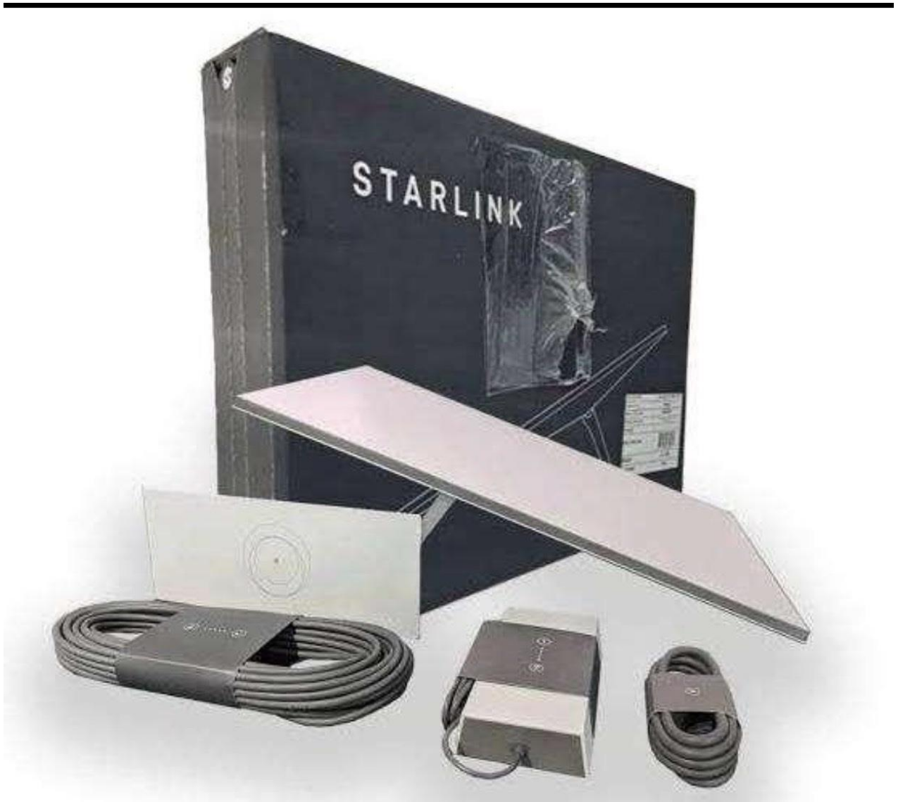
Bộ thiết bị Starlink